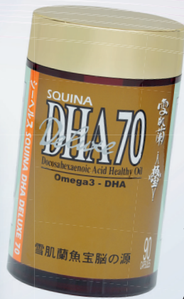
雪肌蘭魚寶腦之源DHA