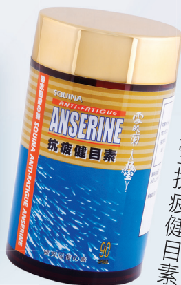
雪肌蘭魚寶抗疲健目素