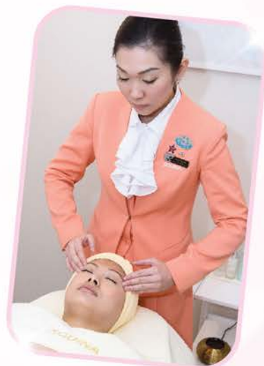
留日專業美容師正進行「日本氣功穴位美容治療按摩護理」，運用氣功為客人調理身體，同時令肌膚緊緻、亮澤，體驗由內而外健美之道。