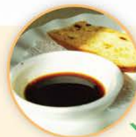
13卡路里 1湯匙意大利黑醋

豐富纖維能增加飽足感，避免過量進食，進食沙律須留意醬汁選擇，選不好，隨時脂肪與熱量爆標，可選擇意大利黑醋，建議少選千島醬、蛋黃醬等。