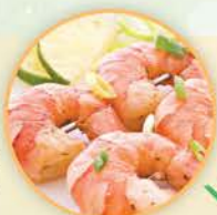
78卡路里 100克中蝦 (2隻)