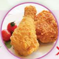
437卡路里 1件連皮炸雞