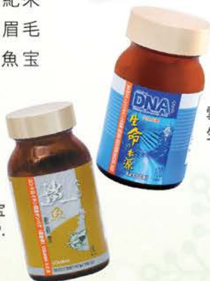
雪肌蘭魚寶 生命之本源DNA