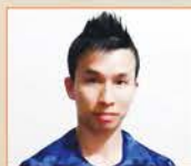
資料提供： King Chung 高級私人體適能 及伸展教練