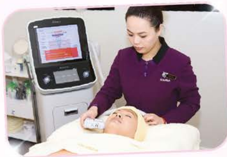
採用先進美容儀器，配合八極療程，客人真正體驗到快速年輕10年的美肌效果。