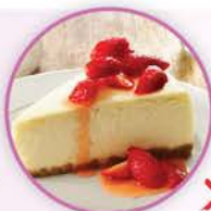
342卡路里 1件芝士蛋糕