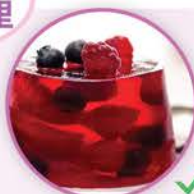
96卡路里 1份鮮果啫喱