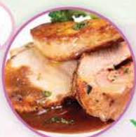
156卡路里 1片去皮烤火雞