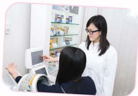
專業營養師利用先進的評估儀器，讓客人全面了解自身的健康，並建議合適的營養諮詢。