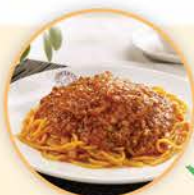
540卡路里 1碟肉醬意大利粉

選擇白飯或少醬汁麵食，麵食可選擇意大利粉，這較千層麵、長通粉為佳，因為寬身多空隙的麵食，吸附醬汁較多，讓人不知不覺多吸收熱量。