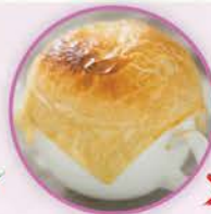
410卡路里 1碗酥皮忌廉湯