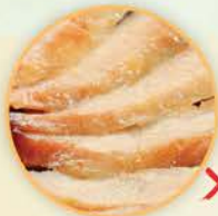
224卡路里 100克豬頸肉 (約3片)