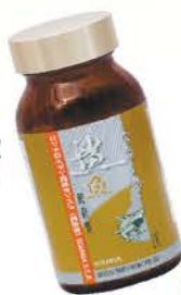
雪肌蘭魚寶 鯊魚軟骨素S.C.P.

另外，由於工作關係，本人經常要長時間站立，導致雙腳容易酸軟、浮腫，很容易累，但自從使用「完美足部修護霜」幫雙腳按摩，以上腳部問題很快便消失，現在還可以到處去旅行。我對雪肌蘭產品充滿信心！