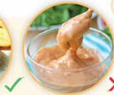
58卡路里 1湯匙千島沙律醬