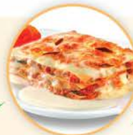
762卡路里 1碟肉醬意大利千層麵