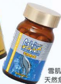
雪肌蘭魚寶 天然魚的鈣