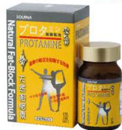
雪肌蘭魚寶天然阻脂素