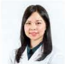
資料提供： 資深營養師 Koey Tsang

女性天生脂肪率較男性高，而且受雌激素影響，體內脂肪通常會積聚於下身、大腿及臀部，容易呈現「梨形」身材。想雙腿均勻修長，除進行適當運動提高代謝率以燃脂外，必須維持均衡飲食，避免吸收過多脂肪而積存體內。補充提煉自三文魚白子的「魚精蛋白」，能即時阻礙膳食脂肪吸收、提升飽足感及控制食慾，有助塑造完美健康體態。