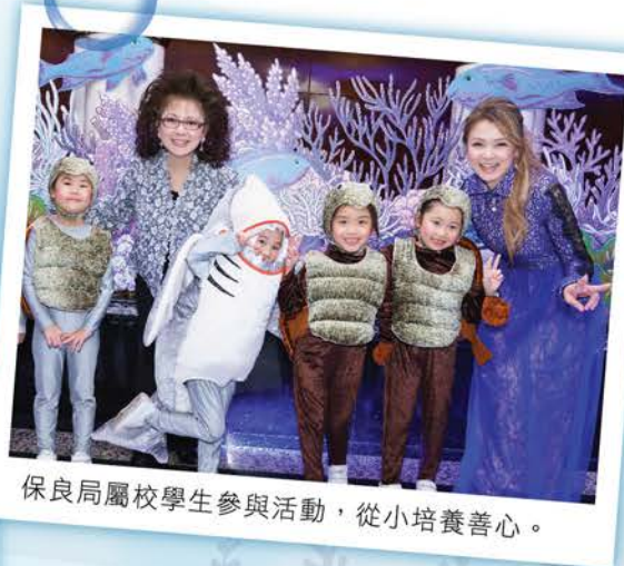
保良局屬校學生參與活動，從小培養善心。