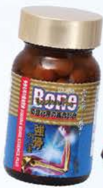
雪肌蘭魚寶 強骨の宝