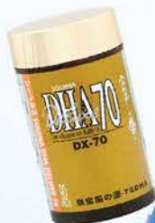
雪肌蘭魚寶 腦の源DHA