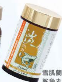
雪肌蘭魚寶 鯊魚丸