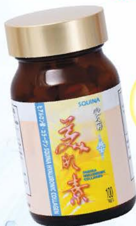
雪肌蘭魚寶美肌素