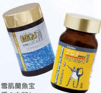
雪肌蘭魚宝 淨の丸EPA