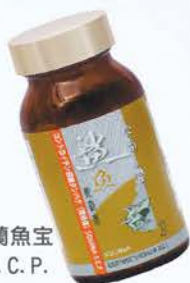
雪肌蘭魚寶 鯊魚軟骨素S.C.P.