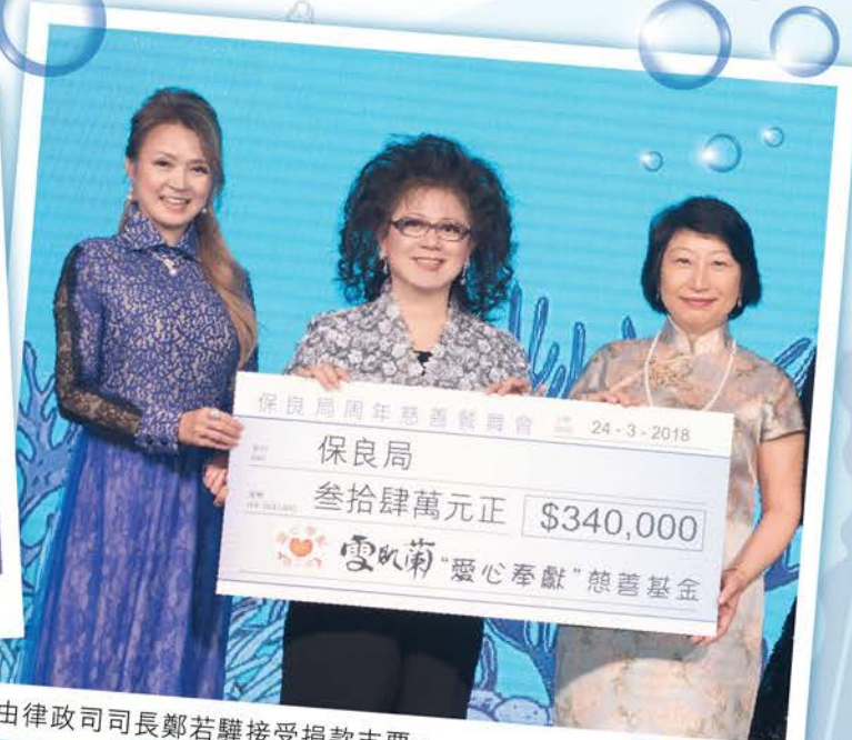
由律政司司長鄭若驊接受捐款支票。