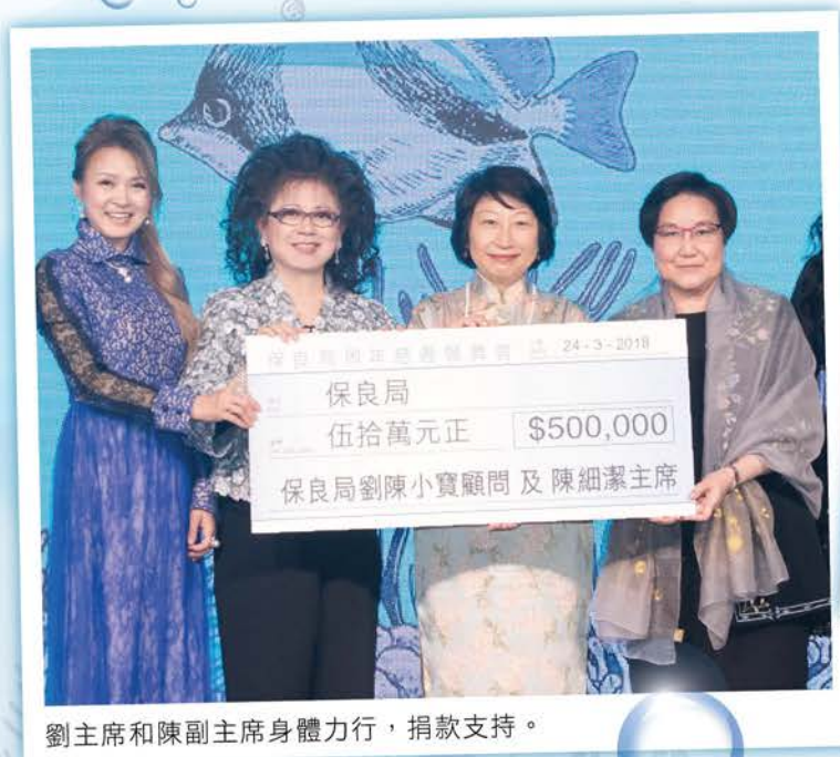
劉主席和陳副主席身體力行，捐款支持。

當晚會場猶如海洋世界，有小朋友扮演可愛鯊魚仔、小海龜、小鯨魚…還有打扮得花枝招展的美人魚；善長們都非常開心，度過了難忘的一夜，完全體現到行善最樂。