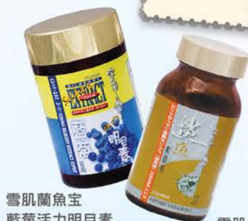
雪肌蘭魚宝 藍莓活力明目素