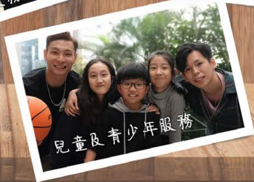
兒童及青少年服務