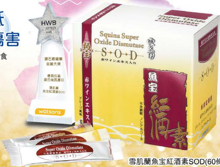
雪肌蘭魚寶紅酒素SOD(60條)