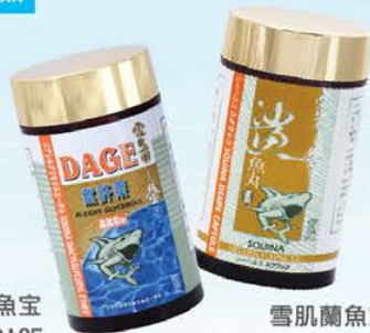
雪肌蘭魚寶 鯊肝素DAGE