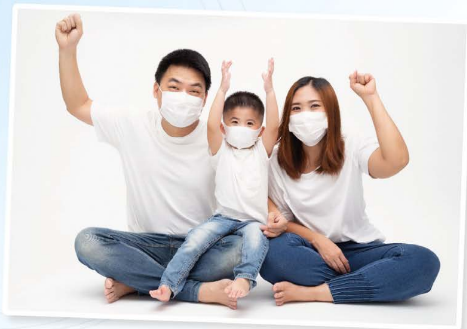
雪肌蘭魚宝淨の丸EPA