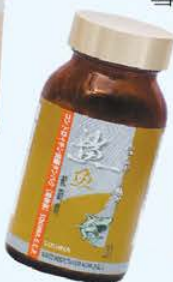
雪肌蘭魚寶 鯊魚軟骨素S.C.P.