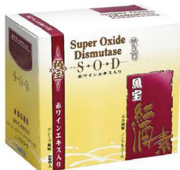
雪肌蘭魚宝紅酒素SOD

SOD是一種抗氧化酵素，其效能比維他命C和E要高。研究顯示，SOD能有效平衡和清除體內多餘自由基，改善免疫力，增強體質，預防心血管疾病。補充足夠的SOD，不但能減低病毒感染，更可減輕接種疫苗的副作用。