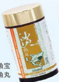
雪肌蘭魚寶 鯊魚丸