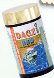
雪肌蘭魚寶 鯊肝素DAGE