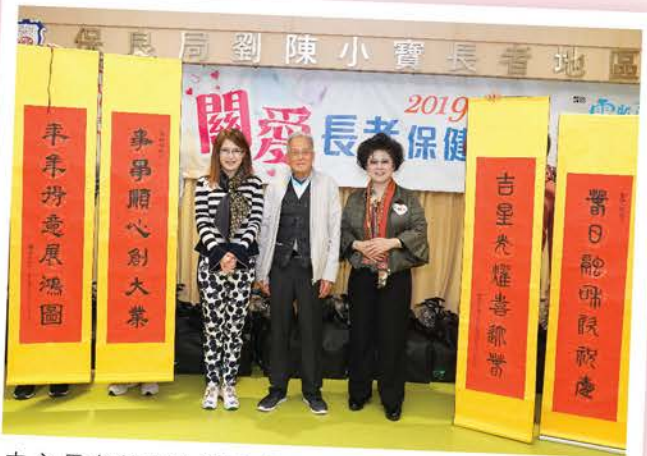
中心長者特為劉主席和陳副主席，送上兩副親筆對聯，以表謝意。