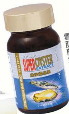
雪肌蘭魚寶蠔皇素

另外，「雪肌蘭魚寶抗疲健目素」含有極速降疲勞及壓力因子。成分中的海洋胜肽精華安肌肽，配合優質DHA，能追蹤及直達疲勞部位，全方位擊退倦態，提升活力。