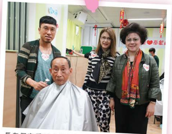
長者們享受到「星級服務」之餘，各髮型師為老友記剪髮，也很高興！