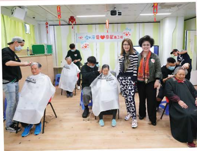
一眾髮型師「剪不停手」，密密為各老友記剪出稱心如意的新髮型。

12年來，「雪肌蘭愛心奉獻義工隊」一直為長者舉辦不同類型活動，讓老友記感受到社會的關懷與重視。早前，義工隊聯同10位HAIR星級專業髮型師，在「保良局劉陳小寶長者地區中心」向老友記施展「髮」術，幫他們「剪頭髮」過新年。在場長者大讚髮型師們專業又細心；而髮型師團隊見一眾長者笑逐顏開，自己也感到十分開心及很有意義。未來，義工隊會繼續籌組與各界的專業團隊合作，提供更多類型的服務給老友記。