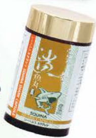
雪肌蘭魚寶 鯊魚丸