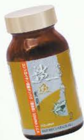
雪肌蘭魚宝 鯊魚軟骨素S. C. P.