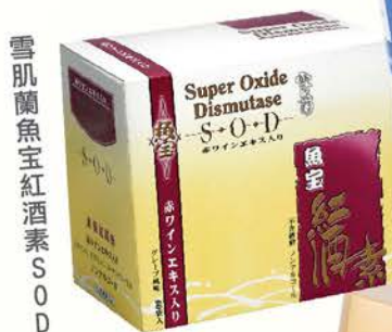
雪肌蘭魚寶紅酒素SOD