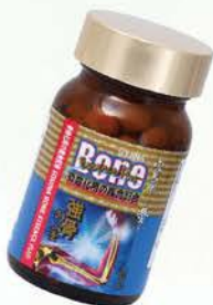
雪肌蘭魚宝 強骨の宝