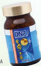
雪肌蘭魚寶 生命之本源DNA