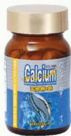
雪肌蘭魚宝 天然魚の鈣