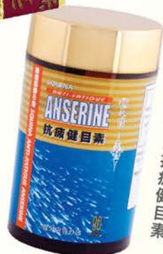
雪肌蘭魚寶抗疲健目素