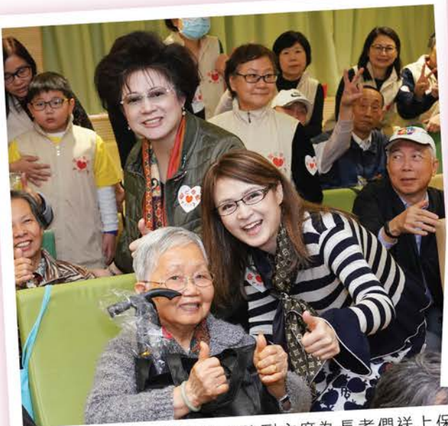
天氣乍暖還寒，劉主席和陳副主席為長者們送上保暖禮品，各老友記倍感溫暖。