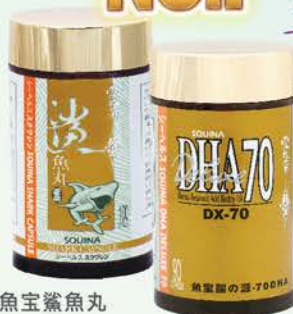
雪肌蘭魚宝鯊魚丸