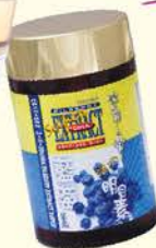
雪肌蘭魚寶藍莓活力明目素