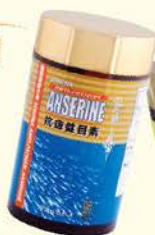
雪肌蘭魚寶抗疲健目素