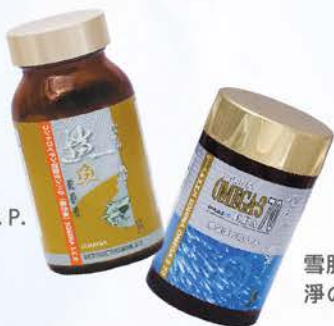
雪肌蘭魚寶 淨の丸EPA