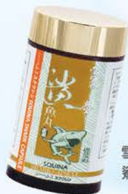
雪肌蘭魚寶 鯊魚丸