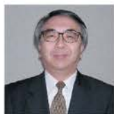
著名日本醫學及藥劑學博士 西川正純博士