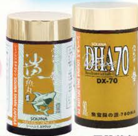
雪肌蘭 魚寶鯊魚丸