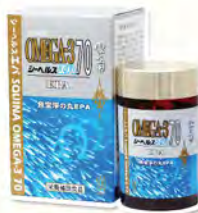
雪肌蘭魚寶 淨の丸EPA