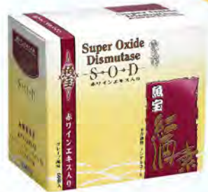
雪肌蘭魚宝紅酒素SOD