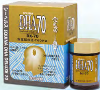
雪肌蘭 魚寶腦之源DHA70 (30粒)