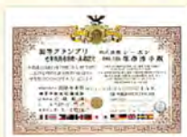
美容護理所使用的 Facialist護膚品 榮獲世界優秀技術大獎