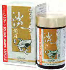
雪肌蘭魚寶 鯊魚丸