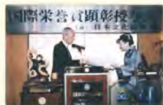
日本氣功穴位美容 治療按摩護理 榮獲「社會文化功勞獎」