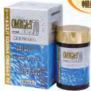
雪肌蘭魚宝淨の丸EPA