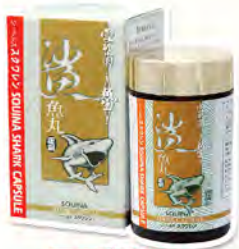
雪肌蘭魚寶 鯊魚丸