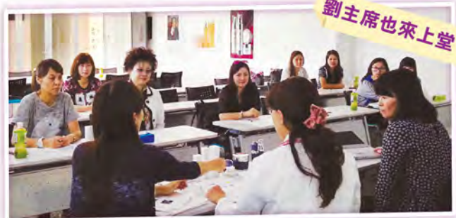
▲ 日本導師詳細解釋新產品的特點和效能，連劉主席都有來上堂呢！

雪肌蘭以客為本！為配合雪肌蘭天然護膚品快將推出多個新產品系列，今年的日本深造課程，特別安排一系列產品研修課程，由日本專業導師講解，增加員工對產品有更專業的認識，為顧客解答所需，從而作出適合的選擇。由此可見，雪肌蘭連續多年獲得「專業客戶服務大獎」是實至名歸的。