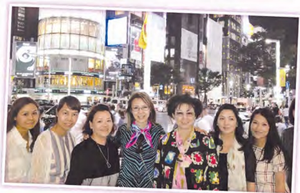
▲ 大家難得來到購物天堂日本，完成緊張的課程後，當然是盡情購物了。