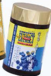
雪肌蘭魚宝藍莓活力明目素