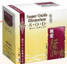
雪肌蘭魚寶紅酒素SOD