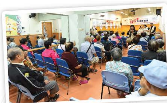
▲ 由護士義工擔任導師的「簡易穴位按摩講座」，反應十分熱烈，全場坐無虛席。