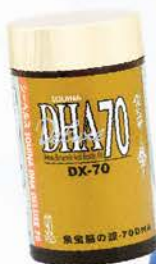
雪肌蘭魚宝腦の源DHA