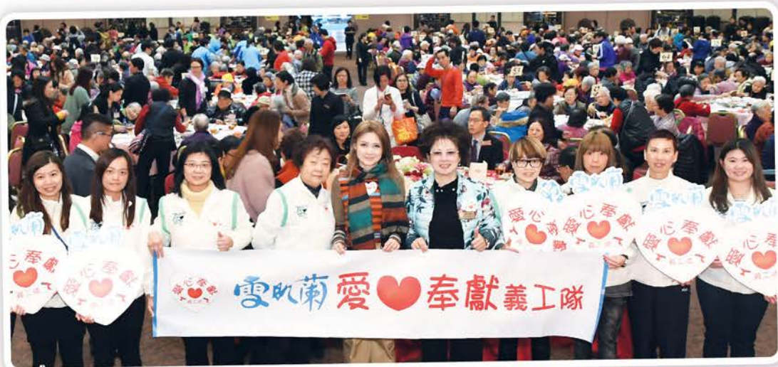
▲ 劉主席和陳副主席與雪肌蘭愛心奉獻義工隊出席新春活動，與千名長者歡度佳節。

計劃推行以來，劉主席和陳副主席均從不間斷、身體力行支持活動，並帶領「雪肌蘭愛心奉獻義工隊」一齊參與探訪，讓長者感受社區溫暖。日前出席「關懷長者心閉幕禮暨敬老賀新春」，與逾千名長者一齊食春茗，場內充滿節日歡欣，喜氣洋洋，劉主席和陳副主席更向各位長者拜年，祝大家健康！令長者感受到節日祝福及社區溫暖。