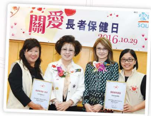
▲ 劉主席和陳副主席頒發紀念狀給兩位講師，感謝她們對活動的支持。

活動在劉主席和陳副主席帶領下，與雪肌蘭愛心義工隊一同前往「保良局劉陳小寶耆暉中心」，親身了解社區長者的需要，為到來的長者做全面健康檢測，和舉辦健康講座，由護士義工擔任導師，教長者學習簡易穴位按摩，幫助長者舒緩常見的健康問題。