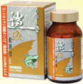
雪肌蘭魚寶鯊魚軟骨素S. C. P.