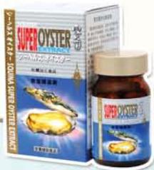
雪肌蘭魚寶 蠔皇素