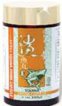
雪肌蘭魚寶 鯊魚丸

健美業界一年一度矚目盛事「屈臣氏健康美麗大賞2014」頒獎禮，經已圓滿結束，雪肌蘭以大熱姿態，連續15年獲得全場最高獎項「至尊榮譽」大獎，和多個全場最高銷量大獎，再次以實力證明，是名副其實的天然健康食品專家。