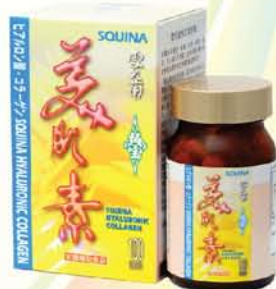
雪肌蘭魚寶美肌素