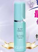
雪肌蘭 修護保濕緊緻 美容液