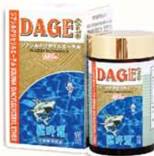
雪肌蘭魚寶 鯊肝素DAGE