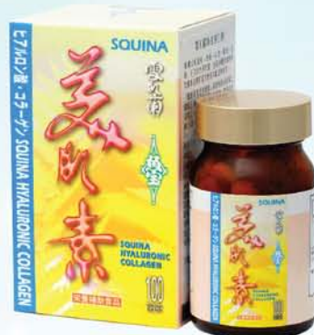
雪肌蘭魚寶美肌素