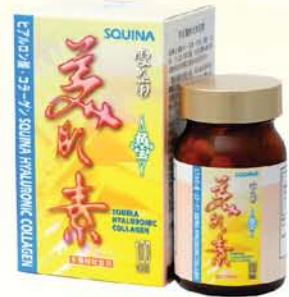
雪肌蘭魚寶美肌素

雪肌蘭魚寶天然健康食品含有獨特成分「鯊魚軟骨素硫酸蛋白複合體S. C. P.」，繼日本和美國頒發多項效能專利認證，最近，再次成功獲歐盟專利局頒發專利，共40個國家效能專利認證，鐵一般證實，產品成分獨一無二，證實有效平衡尿酸，改善關節健康。