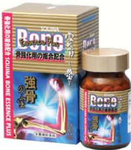
雪肌蘭魚寶強骨の宝