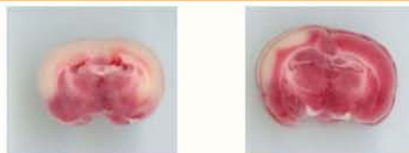
沒有服食DNA核酸(左)，其腦細胞受損(白色部分)明顯較多，有服食DNA核酸(右)，腦部受損程度大大降低。

預防中風除了通過膳食和藥物外，還可以結合相應的保健品，針對性地調理身體機能，促進腦血管健康，如深海魚油Omega-3 DHA能降低膽固醇，增強血管壁彈性。此外，DNA核酸作為防治中風的保健品有其獨特的優勢。首先，DNA核酸是人體的重要營養素，對免疫系統、腦部發育起了重要作用 1 。其次，DNA核酸能抑制過氧化脂質、膽固醇的形成，改善脂肪代謝、糾正不正常血脂水平，從而改善血流和預防動脈粥樣硬化，防治血管堵塞 2-4 。DNA核酸內含有的核苷有效成分，還能擴張血管末梢、改善腦部血液循環，達到促進腦部訊息傳遞、減少神經細胞凋亡、提高肌肉的協調能力的作用，對中風患者的復康有正面作用 5-6 。DNA核酸與Omega-3 DHA同時使用，不僅有抗抑鬱的作用，還能通過促進神經細胞膜及軸突的製造，有效提升學習及記憶力，對腦部健康有協同效果 7-8 。