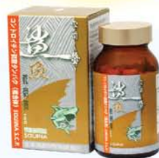
雪肌蘭魚寶 鯊魚軟骨素S.C.P.