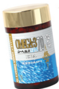
雪肌蘭魚宝 淨の丸EPA