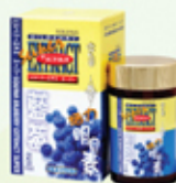
雪肌蘭魚寶 藍莓活力明目素