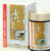
雪肌蘭魚寶 鯊魚丸