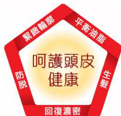
C'BON柑枇精 SCALP營養液 150ml