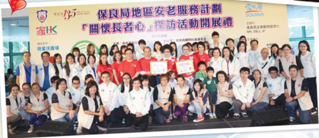
▲ 雪肌蘭「愛心奉獻」義工隊及護士義工隊，在Angel和Abbie的帶領下，將展開一連串的義工探訪活動，為長者獻出關懷。