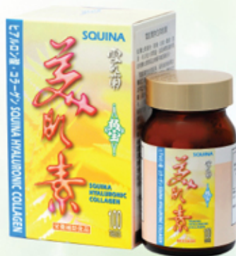
雪肌蘭魚寶美肌素