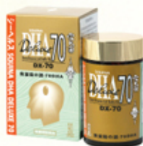
雪肌蘭魚寶腦の源DHA