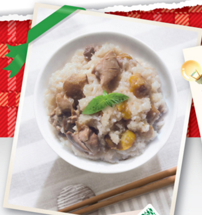
雞肉栗子蒸糯米飯 Steam Chicken and chestnut in glutinous rice

冬季是養生的重要時刻，要增加熱量補充，以抵禦體溫流失，以下簡易菜式溫暖但低脂美味，讓您過一個暖烘烘的冬天。