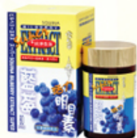
雪肌蘭魚寶藍莓活力明目素