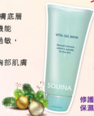
修護膠原蛋白 保濕面膜