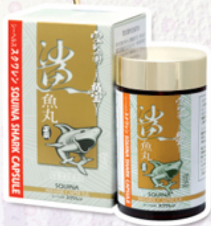
雪肌蘭魚寶 鯊魚丸

衷心希望我的朋友們都有耐心和信心去選擇合適的雪肌蘭天然健康食品，從而擁有健康的體魄。值得一提的是，雪肌蘭的健康顧問都是經驗豐富而和藹可親，多年以來我們已成為好朋友！