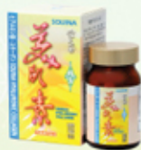
雪肌蘭魚寶 美肌素