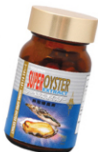
雪肌蘭魚宝 蠔皇素